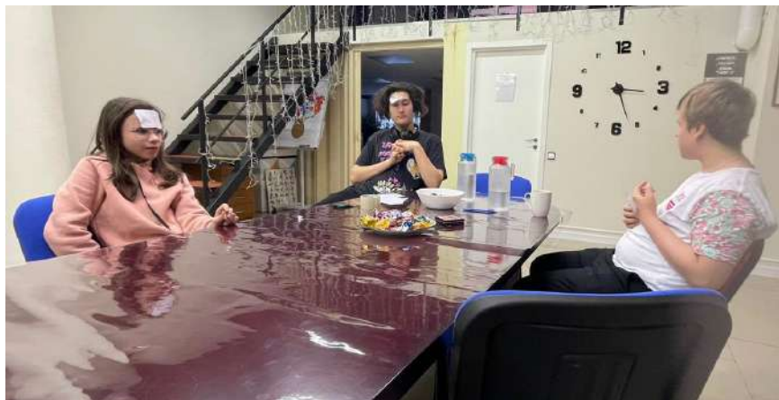
Фото отчет «Подросткового клуба»